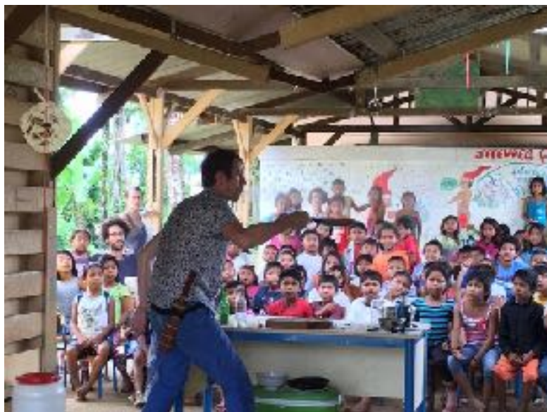
Ecole élémentaire de Camopi - Guyane - mars 2017