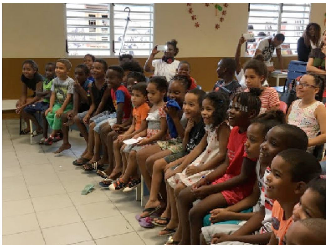
Maison de quartier du Village Chinois - Cayenne - Guyane - mars 2017

Les représentations peuvent se prolonger par des débats préparés et menés en fonction des publics et des réalités locales.